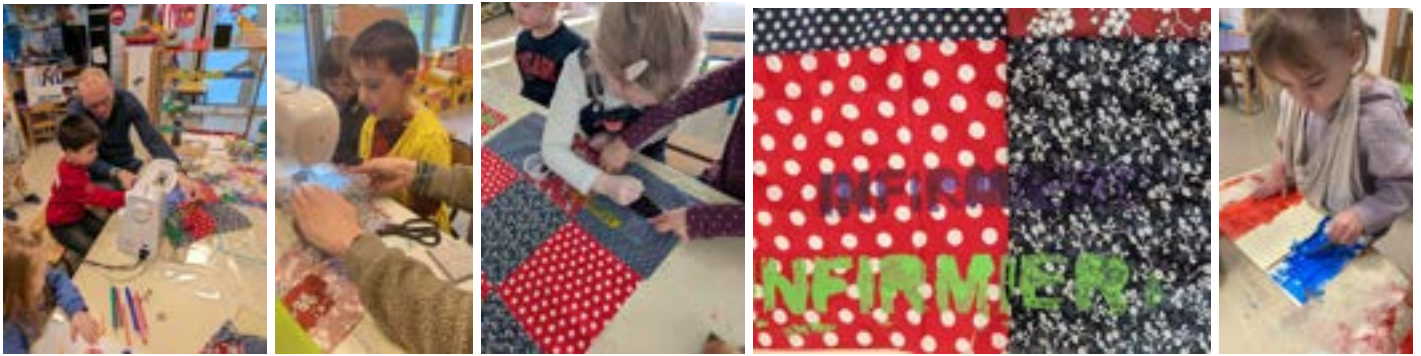
🇫🇷 Maternelle journée de la laïcité.mp4

https://drive.google.com/file/d/1G2PsYCNfK801bfFJ9Nhv0dAnO6caKagV/view?usp=drive_link